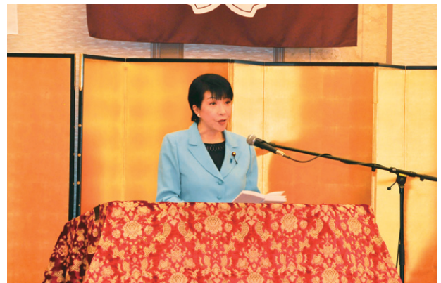
式辞を述べる高市総務大臣