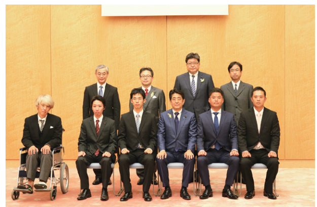
記念写真（前列右から丸林氏、富田氏、安倍内閣総理大臣、大谷氏、山田氏、三輪氏。後列右から青木消防庁長官、萩生田内閣官房副長官、世耕内閣官房副長官、金高警察庁長官）